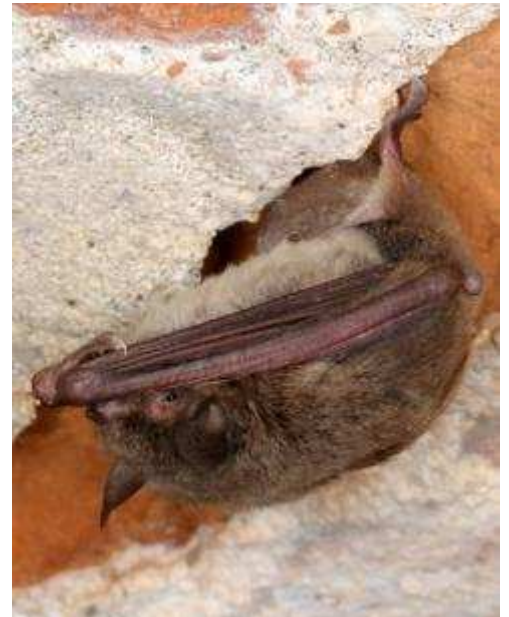
Murin de Capaccini - 1316 Myotis capaccinii