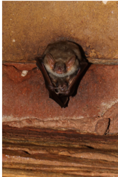
Le Petit murin – 1307 Myotis blythii