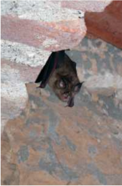
Le Grand rhinolophe – 1304 Rhinolophus ferrumequinum