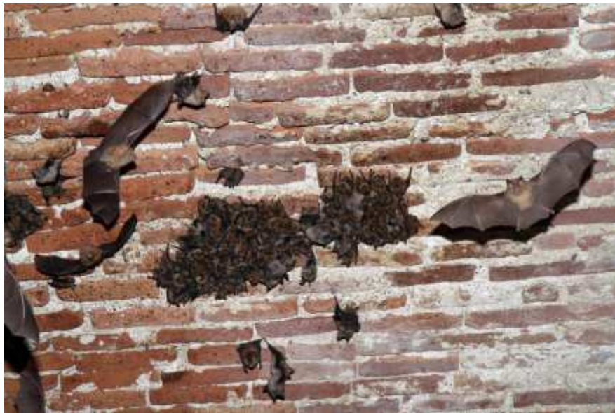
Colonie mixte Murin à oreilles échancrées - 1321 / Myotis emarginatus Grand Rhinolophe – 1304 / Rhinolophus ferrumequinum