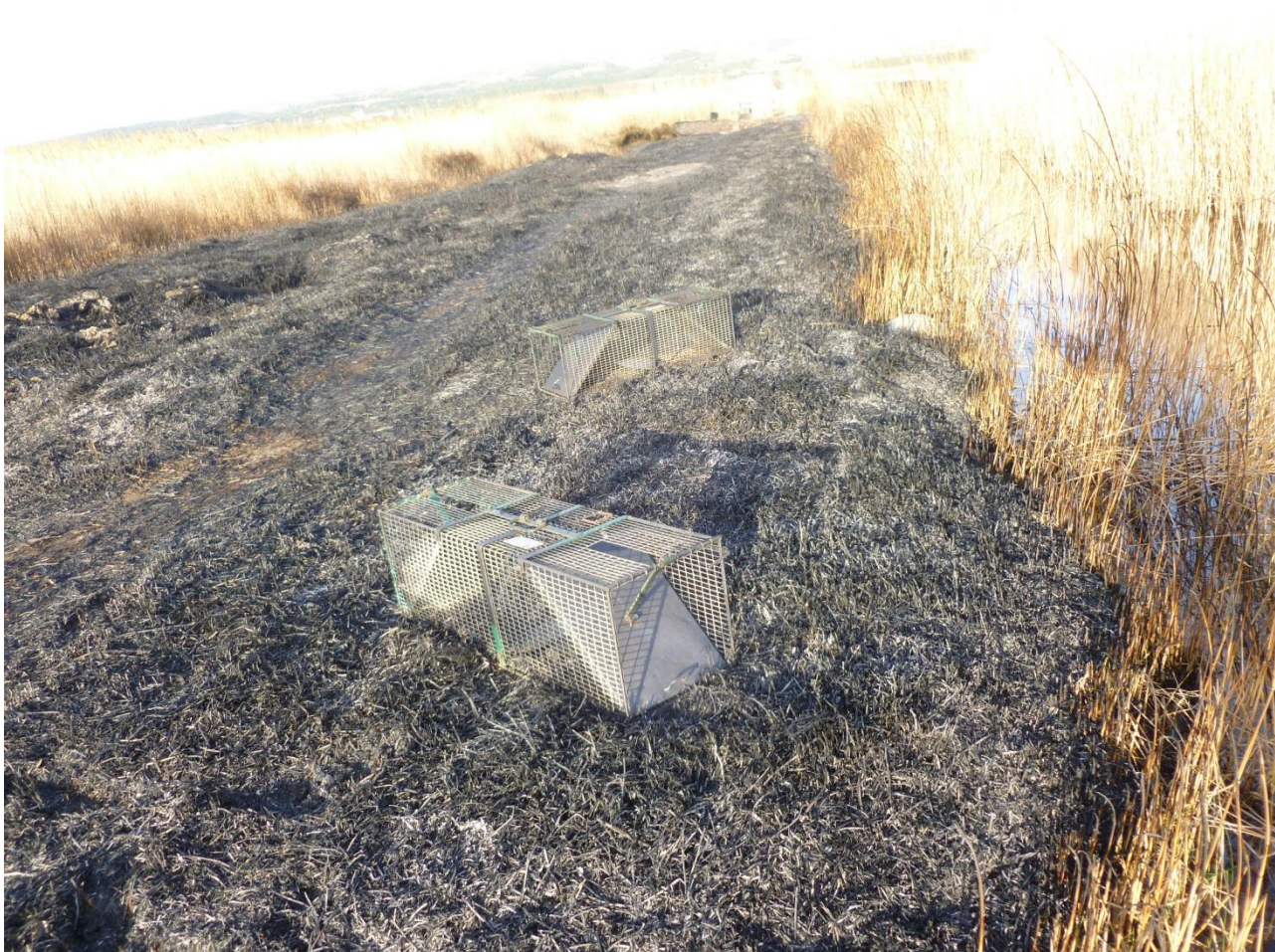
Photo 1 : Cages-pièges endommagées par l'incendie (agouille du moteur) (FDC66)

Cependant, l'incendie qui a eu lieu le 13 février 2014 a sévèrement endommagé 7 cages pièges placées les long des agouilles retroussats et du moteur ( photo 1 ). Ces cages sont depuis inutilisables.