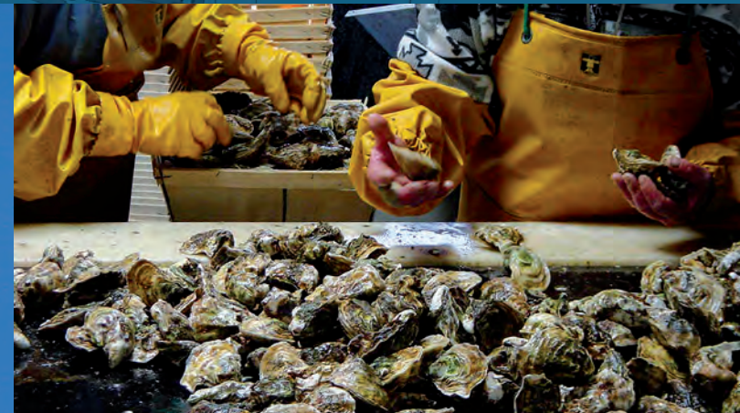
Détroupage des huîtres