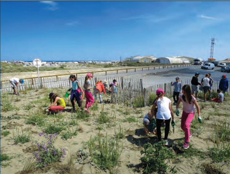
Animations auprès de scolaires sur les espaces extérieurs de la Maison de l'étang