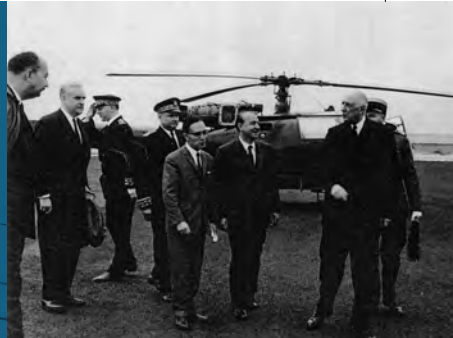
Visite du général de Gaulle lors de la construction de Port-Leucate

ENTRÉE LIBRE VISITES COMMENTÉES SUR RÉSERVATION (GRATUIT)