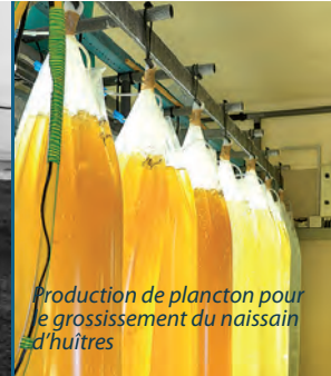
Production de plancton pour le grossissement du naissain d'huîtres